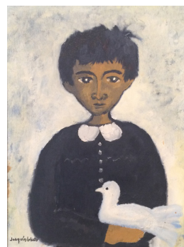
JOAQUÍN LOBATO Niño con paloma, s/f Óleo sobre tabla