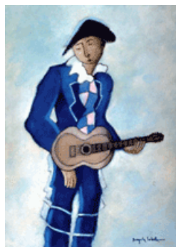
JOAQUÍN LOBATO Arlequín, s/f Óleo sobre tabla